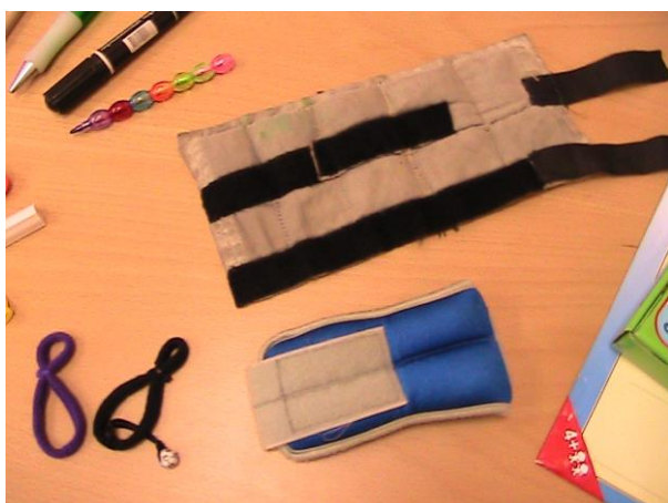
Утяжелители и фиксаторы пишущего предмета.